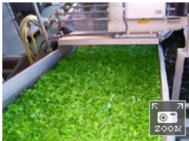
Le disposizioni sull'origine penalizzano le PMI agroalimentari - Altre fotografie

La norma che ha per oggetto tutti i prodotti di origine/provenienza non italiana sui quali sia apposto un marchio d'impresa italiano, con le nuove disposizioni l'etichettatura deve riportare chiaramente l'origine non italiana. Questo provvedimento non dovrebbe coinvolgere il settore alimentare, disciplinato con disposizioni comunitarie specifiche. Infatti, a giudizio di UnionAlimentari-CONFAPI, questo nuovo approccio accresce nuovamente la disparità tra le condizioni imposte alle imprese italiane e quelle estere, non soggette al provvedimento.